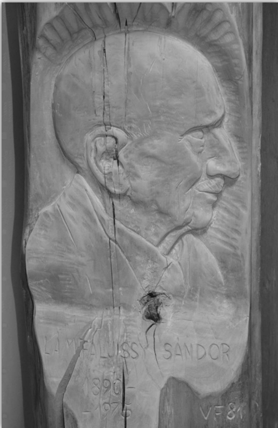
A Nyugat-magyarországi Egyetem Központi Könyvtára Órzi Lámfalussy Sándor Varga Ferenc lenti fajaragó által rönkbe vésett portréját