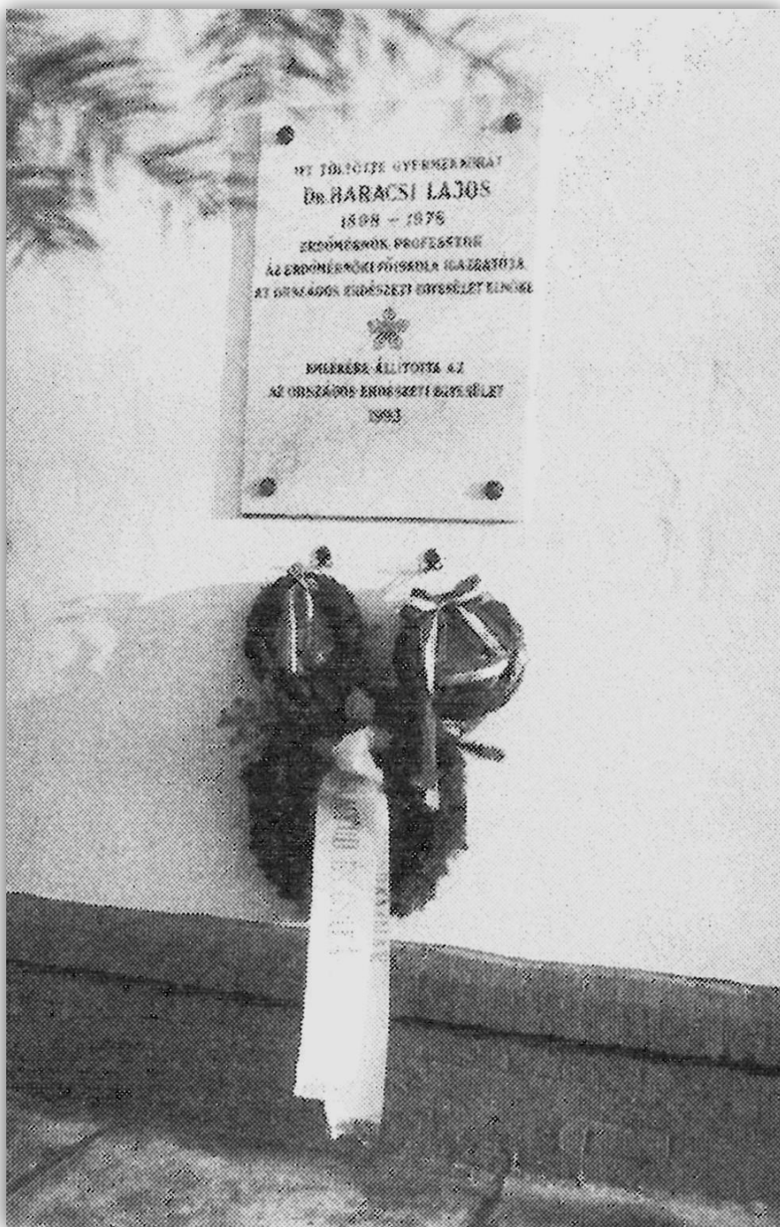
7. OEE által állított emléktábla a Kardospusztai erdészházon