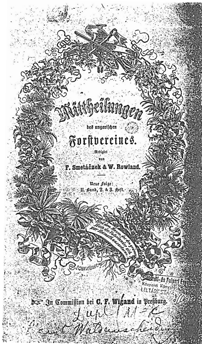
2. kép: A Magyar Erdészegylet Közleményei Megjelent Pozsonyban, 1862-ben